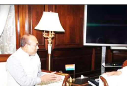
নিউ দিল্লীদগী ফবদা পাউনা হায়, চীফ মিনিস্তর এন বীরেন সিংহনা ভঁসি নুংখিল পূঃ ও রোম অবকলদা য়ুনিয়ন হোম মিনিস্তর রাজনাথকা মখাকী ওফিসতা উমি।

পোকুফম নিউজ সার্বিস ইফ্যাল, মে ১৮ঃ চীফ মিনিস্তর এন বীরেন সিংহনা ভঁসি য়ুনিয়ন হোম মিনিস্তর রাজনাথ উদুনা স্তেত অসিগী থবক ফবদা নহাশিংদা থবক ফবনবগী মখাঙা স্তেতকী সেকুরিতাদা অবাংপা লৈরিবা অসি মেনখনবগীদমক আই আর বি (ইন্দিয়া রিজার্ভ বতালিয়ন) বতালিয়ন মঙা লিংখংপীনবা তকশিনে।