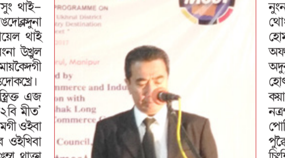
পোকুফম নিউজ সার্বিস ইফ্যাল, মে ১৮ঃ মণিপূৰ মীয়াম অমসুং থাই-লেন্দগী মরুতা অচেংপা মরী হায়না লেঙদেঙদুনা মিনিস্তর কাউন্সিলর (কমার্শিয়াল) ৱোয়েল থাই এগ্ৰেসি, নিউ দিল্লী থাৱাদোল থোক্কনবা উখুল দিল্লিত্ত তুরিজম চাওখংহন্নবা মত্ৰ মীয়ামকগী পাংবা য়াৰা মতেঙ পাংগনি হায়না ফেঙদোকপা।

লৈফম চাফমগী খুদোংচাদবা কয়াদা মীয়ামা নুনবাংবা পোকুৱিবা অসিগী মতাঙদা থাৱাদোল থোক্কনবা হায়খি, থাইলেন্দপা লৈবা মহাকী হোম তামন কেশমইদা চহী ৩০ ৱোমগী মমাঙদা অকবা হোতেল অমসু লৈফম চাফম লৈরমদে। অদুৰ মীয়ামা তুরিজম ইন্ডুস্ত্ৰী থায় য়াওনা কৰা হোংনবদগী কেশমইদা ভঁসিদি ফাইব স্তাৰ হোতেল কৰা হাংদোকপা। উখুলগী ওইনসু লগী-থোং ফতে নগ্ৰাগী লৈফম চাফম মৰাঙ কয়াদে হায়বগী নুনবাংবা পোকুৱিঙাই ওইদে। শুপ্ৰগী মখৌ অরিবদি লেজৰিবা পুন্নিং অসি শীজিল্লদুনা লমকৌইবশিং পুন্নিং চি শিনবগা হোংনবা অদুনি।