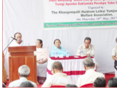
পোকুফম নিউজ সার্বিস ইফ্যাল, মে ১৮ঃ 'আই এমগী শান্তিগী ৱাৱী' মণিপূৰগী চীং-তমগী অপরবগী শক্তাদা পীৱকপা য়াৰা চেফেং হায়বা হীৰমদা পল্লিক দিসকোর্স অমা ভঁসি য়ুজমাও লাইব্ৰেৰী কম্মিউনিতি হৌদাদা পাঙথোকপা।

খাগেমপল্লি হুইদ্রোম লৈকায় য়ুজমাও লাইব্ৰেৰী মেৰা ৱেলফিয়র এসোসিয়েশন শীন্দুনা পাঙথোকখিবা মখা লাঃ ৯, কলম ৭ তা